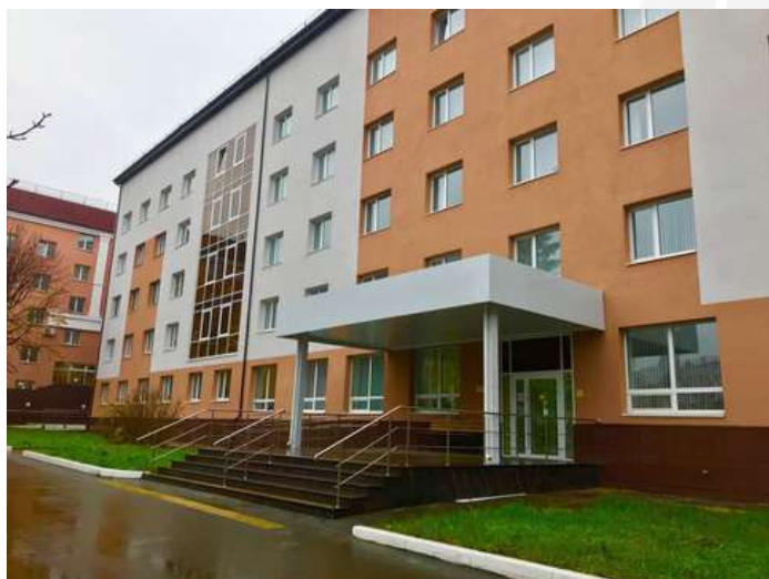
Общежитие № 1, 2 г. Саратов, ул. Московская, 164

Информация о количестве мест в общежитиях Поволжского института управления - филиала РАНХиГС для иногородних обучающихся будет размещена не позднее 01 июня 2024 г.