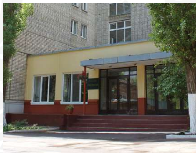
Общежитие № 3 г. Саратов, ул. Шелковичная, 25

По вопросам предоставления общежития обращаться в Отдел социальной работы по телефону: 8 (8452) 65-36-99